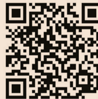
Inquadrare il QR code per accedere ai Piani sanitari di Casagit Salute

https://www.casagit.it - @pianisanitari@mail.casagit.it