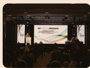
I lavori della 5ª Assemblea nazionale dei rappresentanti dei soci svoltasi a Roma a dicembre 2021

Differenti perché no profit. Casagit Salute è un ente del Terzo settore si distingue, nel panorama nazionale dell'offerta di assistenza sanitaria integrativa, per specifiche caratteristiche nel rapporto con i soci. L'assistenza sanitaria, innanzitutto, copre l'intera vita di chi aderisce alla società di mutuo soccorso e non prevede selezione del rischio in ingresso. In altri termini: il rapporto non si interrompe con l'avanzare dell'età o al termine dell'attività professionale e include anche le prestazioni relative a malattie già presenti al momento dell'iscrizione.