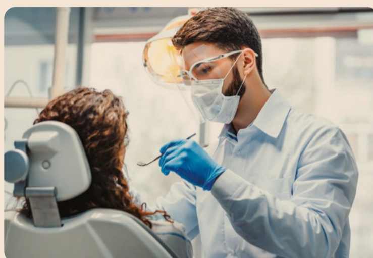
Le cure odontoiatriche vengono fornite da oltre 700 studi convenzionati in Italia

dedicato alla copertura di prestazioni non fornite dal Servizio sanitario nazionale: odontoiatria, terapie di riabilitazione, assistenza alla non autosufficienza. Anche nel caso di spese per il dentista o per la fisioterapia, massima è la libertà di scelta tra le strutture convenzionate e non. Il 15 % è infine dedicato alla copertura integrale di quegli oneri, i cosiddetti ticket, che restano a carico degli assistiti in caso di utilizzo del Servizio sanitario nazionale. Accanto ai rimborsi, alle prestazioni in convenzione e alle indennità per la non autosufficienza Casagit Salute fornisce una serie di servizi di assistenza, telefonica e on line, che